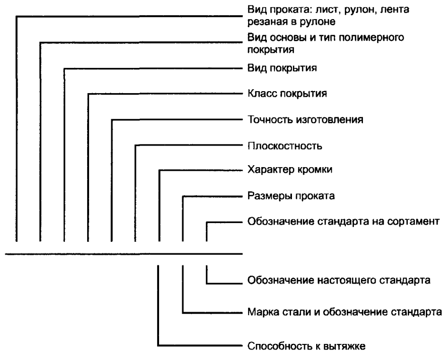
Схема условных обозначений проката с полимерным покрытием

Примечание—При отсутствии какого-либо из параметров его выбирает предприятие-изготовитель.